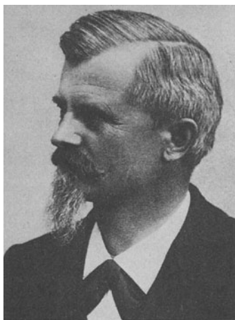
1 Carl Benz (25. 11. 1844–4. 4. 1929)