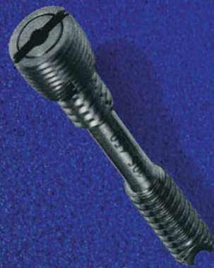
I.CO.S.® Ideal Compression Screw