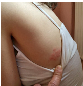
◀ Abb. 1: Herpes zoster linke Flanke

Die Einladung zur künftigen Oscarverleihung ist mir versprochen! ■