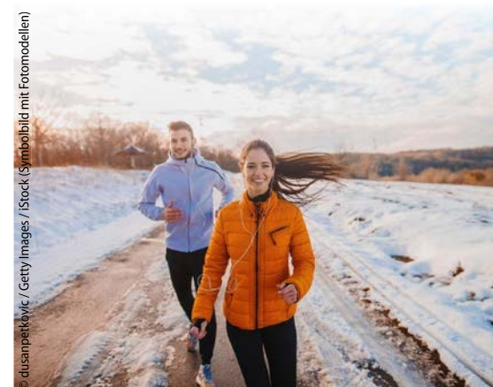
(Symbolbild mit Fotomodellen)