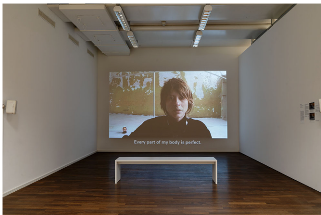
Abb. 1 Installationsansicht im Kunsthaus Zürich, 2019. Elodie Pong, Je suis une bombe , 2006. 1-Kanal-Videoprojektion, Farbe, Ton; erworben als Digital Betacam. Kunsthaus Zürich, Vereinigung Zürcher Kunstfreunde, Gruppe Junge Kunst, 2006. © Elodie Pong.