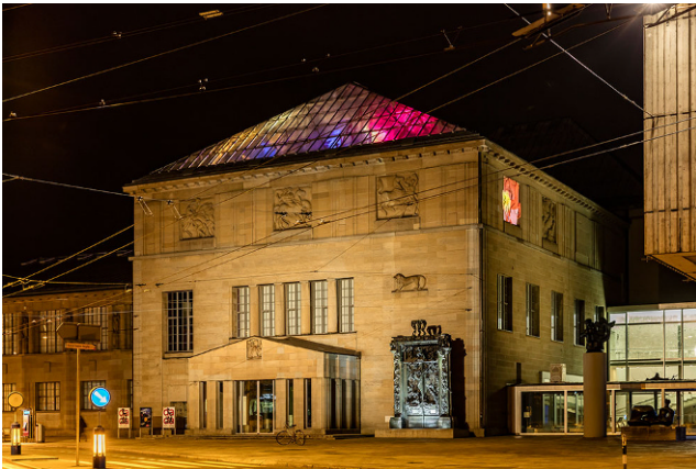
Abb. 3 Installationsansicht Kunsthaus Zürich, 2016. Pipilotti Rist, Tastende Lichter , 2015. Licht- und Videoinstallation, 5 farbige und gesteuerte Moving Lights im Glasdach des Moserbaus und 1-Kanal-Videoprojektion, Farbe, ohne Ton auf Burckhardt-Relief „Amazonenkampf“. © Pipilotti Rist.

lergelieferten Speichermedien: Schon Mitte der 1990er-Jahre etablierte sich der Ankauf von digitalen Magnetbändern wie LTO, Digital Betacam, HDCAM, DVCAM, DVC Pro oder Mini DV, oder externen Speichermedien in Form von Festplatten, USB-Sticks oder SD-Karten, sowie optischen Medien wie DVD, CD, Blue-Ray oder Laser Discs.