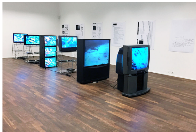
Abb. 2 Installationsansicht im Kunsthaus Zürich, 2015. Simon Denny, Deep Sea Monitors , 2009. 8-Kanal-Videoinstallation, Farbe, Ton, erworben als DVD, bestehend aus 8 Monitoren, 8 DVD-Playern, 3 Untergestelle, 1 TV-Möbel und 6 Xerox-Prints. Kunsthaus Zürich, Videosammlung, Vereinigung Zürcher Kunstfreunde, Gruppe Junge Kunst, 2015. © 2020 Simon Denny. (Foto: Kunsthaus Zürich)

gang mit dieser Kunstgattung noch nicht vollständig vollzogen wurde, oder, weil es an finanziellen oder personellen Ressourcen fehlt.