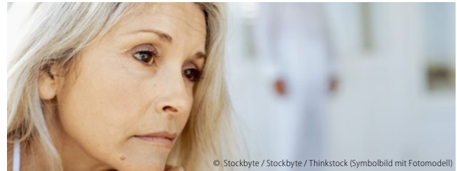
(Symbolbild mit Fotomodell)